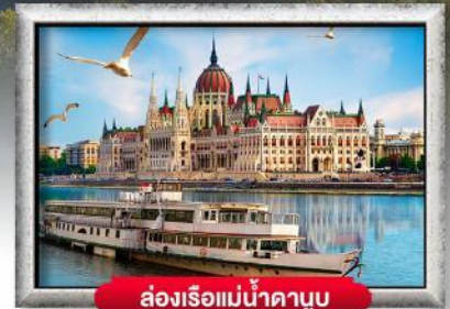
สองเรือแม่น้ำดาบูบ

พิเศษ!! ลิ้มลองเมนูประจำชาติ ทั้ง 5 ประเทศ!!!