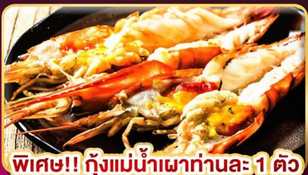
พิเศษ!! กุ้งแม่น้ำเผาท่านละ 1 ตัว